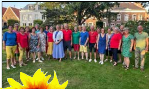
Koor Arabesk in het Waspikse park

We hopen veel trouwe fans te ontmoeten, en tegen mensen die ons nog niet kennen zouden we willen zeggen: grijp je kans en kom genieten van dit gezellige samenzijn! Tot 10 juli, we beginnen om 19.45 uur en om ongeveer 20.30 uur zullen we ons optreden beëindigen. Iedereen is welkom.