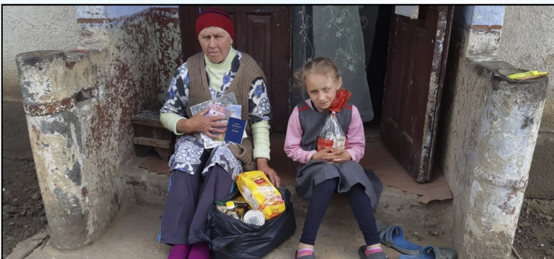
Deze blinde oma woont alleen met haar kleindochter.

en stookhout of kolen. Met een pensioentje van ca. €35,00 - €50,00 / maand en voedsel en energieprijzen die vrijwel gelijk zijn aan Nederland is de armoede zeer schrijnend, zeker als je als opa of oma ook nog kinderen in huis hebt waar je voor moet zorgen. Onvoldoende geld voor eten en brandstof om te verwarmen of te koken. Geen geld voor de dokter of medicijnen. Overleven in bittere kou met te weinig goed voedsel. Hoe bitter kan het lijden zijn? Wat vragen we aan de mensen van Waspik? Daarom doe ik een dringend beroep op uw/jouw vrijgevigheid. Vrijwel dagelijks ontvangen we noodkreten om hulp van onze lokale contactpersonen in Moldavië. Vrijwilligers die dagelijks in touw zijn voor de allerarmsten. Maar ook berichten van grote dankbaarheid voor de hulp die geboden wordt. Er is grote honger onder kinderen, ouderen en straatarme gezinnen. De vrijwilligersteams in Moldavië staan klaar om hulp te verlenen. Ze zijn daarbij afhankelijk van humanitaire hulp van Movu-Moldova omdat ze zelf echt niks hebben en de overheid ook onvoldoende middelen heeft om te helpen. Ze zijn dus afhankelijk van mensen zoals jij en ik. Natuurlijk zijn het ook in Nederland voor velen zware tijden door de enorme prijsstijgingen van boodschappen en energie. De vraag is dus ook heel concreet en gericht aan degene die nog genoeg hebben om te delen. Elke gedoneerde euro komt volledig en zonder overhead aan bij hen die het nodig hebben. robhendriks@live.nl of 06-51177860. Help!