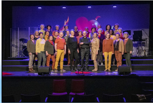
Koor Arabesk anno 2022: spinglevend!

Na het grootse jubileumconcert van afgelopen maart hebben de koorleden van Arabesk er voor gekozen om wat kleinschaligere optredens te gaan verzorgen. Op 27 november dachten zij dan ook dat ze in de foyer in den Bolder een concertje zouden geven. Maar dat pakte anders uit. Honderd kaarten werden er verkocht voor het Mikkemannenconcert en de toeschouwers genoten daarom met zijn allen in de prachtig aangeklede grote zaal in herfstferen van een spetterend optreden en in de pauze van een heerlijke warme Mikkeman. Ook voor Kerst staat het nodige gepland. We