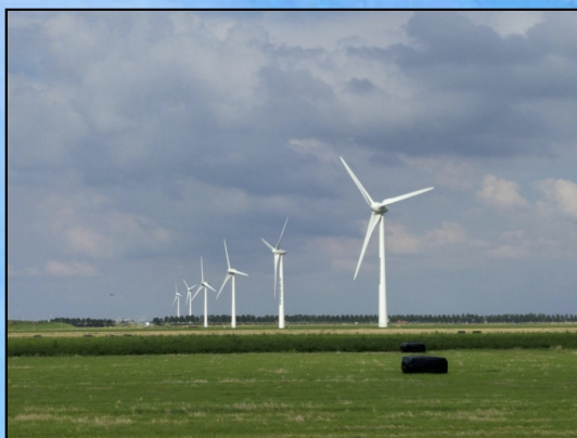
In de Kadernota is gemeld dat er windmolens ten noorden van De Maasroute komen, maar waar precies?

Al geruime tijd speelt het onderwerp 'Energietransitie' een belangrijke rol in het landelijke klimaat. Zoals menigeen zal begrijpen, geldt deze transitie niet enkel en alleen op landelijk niveau, maar zal er ook op lokaal niveau aan verscheidene voorwaarden voldaan moeten worden. Mede daarom is er vanuit het Platform Waspik al geruime tijd een werkgroep aan de slag om het thema energietransitie onder de loep te nemen en te houden. Op dit moment is de vastgestelde Kadernota Grootschalige Opwek Duurzame Energie van de gemeente Waalwijk daarin de leidraad. Vanuit Platform Waspik volgen we dit traject op de voet en daarom zullen we 16 januari, 19.30 uur een informatieavond organiseren waarbij we de huidige stand van zaken graag met u doornemen. Het uitgangspunt van Platform Waspik is dat alle inwoners van Waspik zo minimaal mogelijk beïnvloed worden door